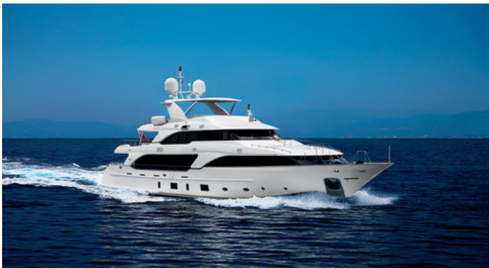
Эктерьер Venetti Classic 121