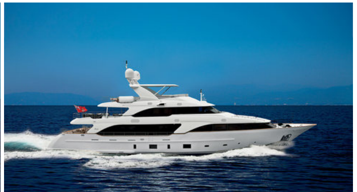
Эктерьер Venetti Classic 121