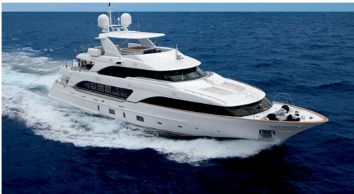
Эктерьер Venetti Classic 121