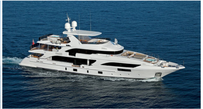
Экстерьер Benetti Supreme 132