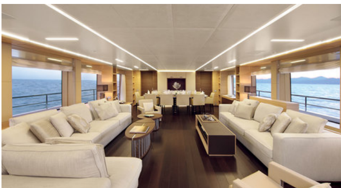
Салон на главной палубе