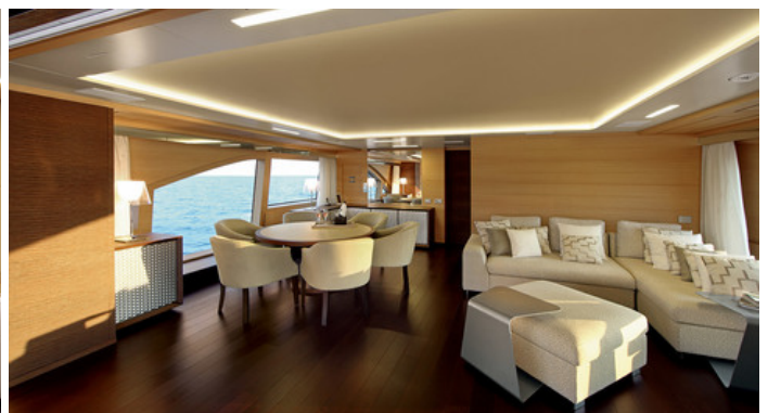
Салон на главной палубе