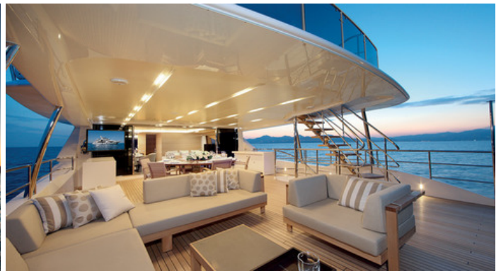
Кормовая часть верхней палубы