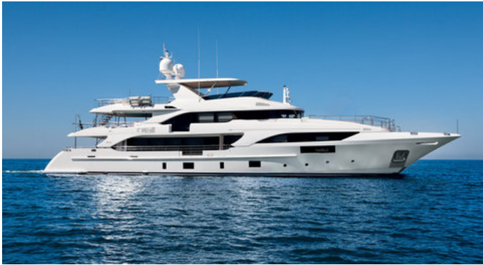
Экстерьер Benetti Supreme 132