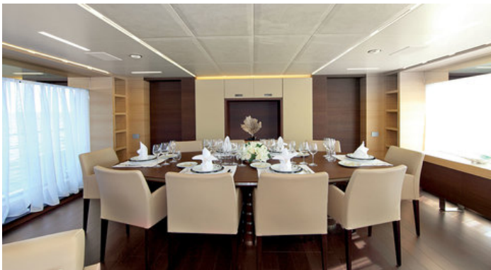
Обеденная зона в салоне на главной палубе