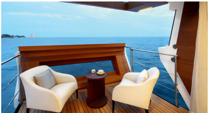
Балкон в каюте владельца