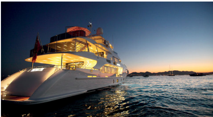
Экстерьер Benetti Supreme 132