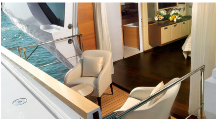
Балкон в каюте владельца